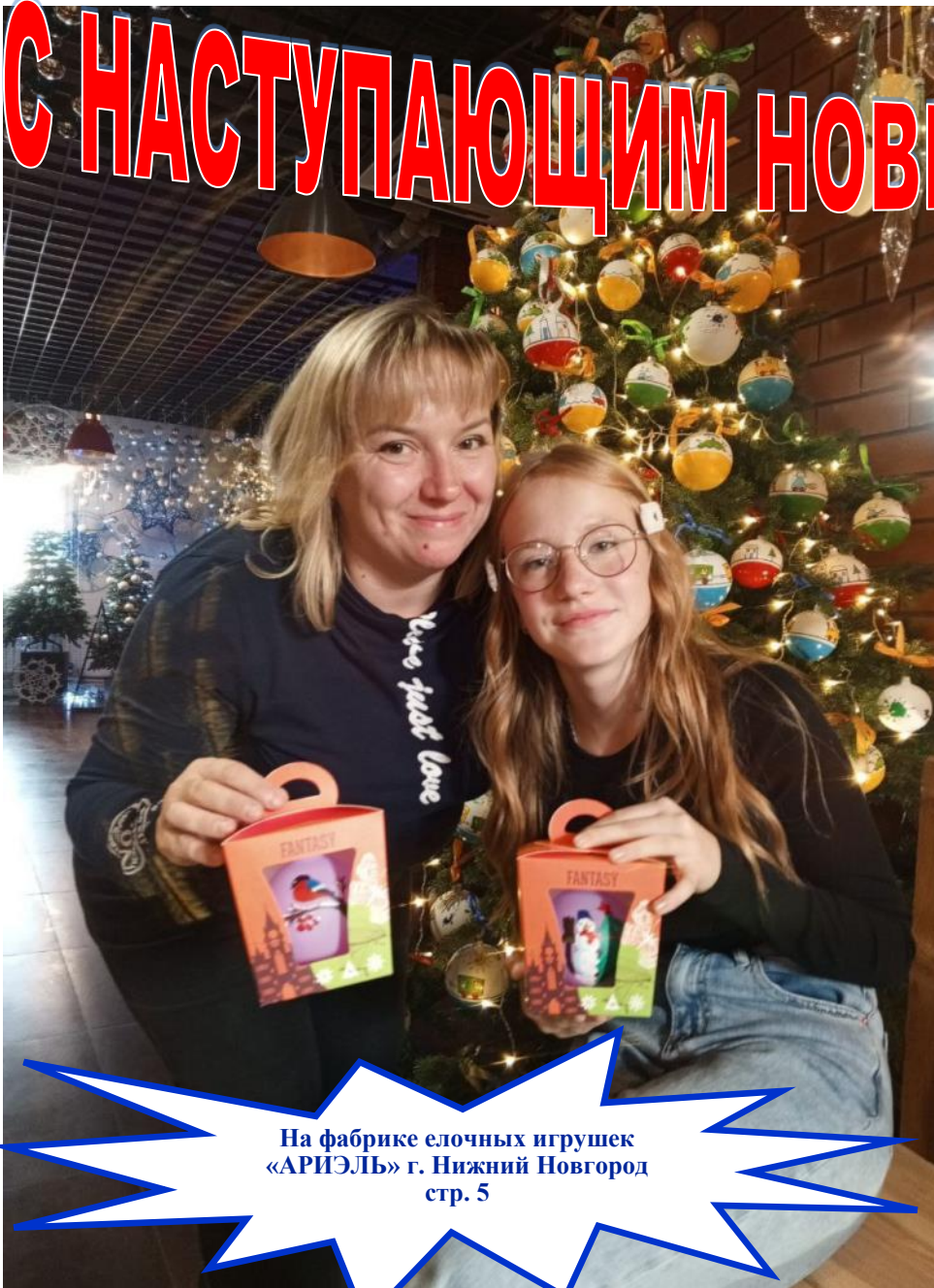
На фабрике елочных игрушек «АРИЭЛЬ» г. Нижний Новгород стр. 5