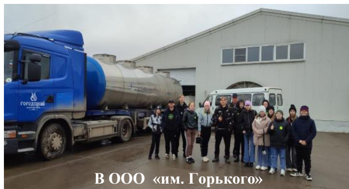
В ООО «им. Горького»