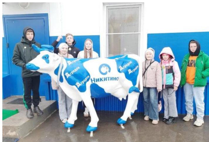
В ООО «Никитино»