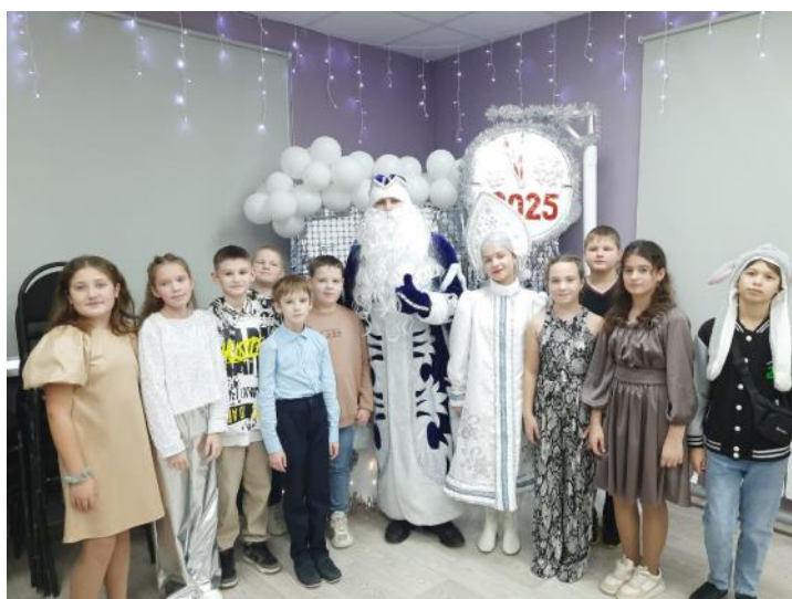
Пятиклассники в предвкушении новогоднего представления в ДДТ г. Урень.

Новогодние праздники я люблю за ожидание чуда, за ощущение сказки и волшебства, которые они приносят. Люблю наряжать ёлку, готовить подарки для близких и друзей, а также проводить время с семьёй за праздничным столом.