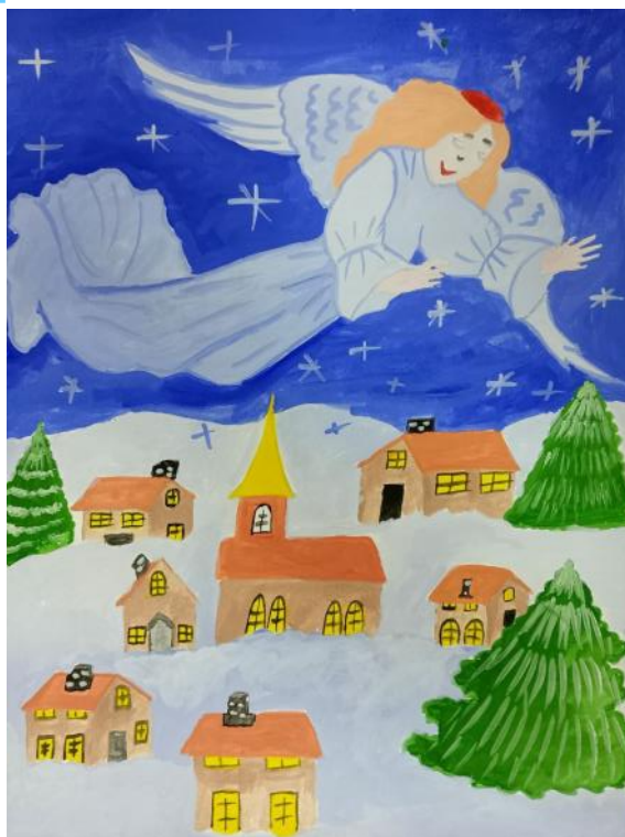
Рисунок Ксении Швецовой, 1 класс