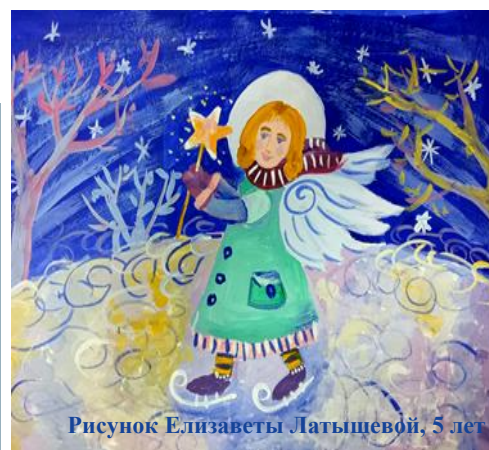
Рисунок Елизаветы Латышевой, 5 лет

*** Это утро, радость эта, Этот снег, метель вот эта, Эти птицы и кормушки, Эти зайцы на опушке, Всё белеет, всё красиво, Всё светло и живо! Этот иней на берёзах, Словно изумруды в слёзах, Эти зимние селенья В ожидании мгновенья— Счастья, праздника, чудес, Волшебства ждёт зимний лес! Соловьева Ксения, 7 класс