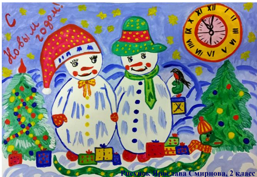
Рисунок Ирисава Смирнова, 2 класс

Я люблю, когда к нам на новогодние праздники приезжают родственники с детьми. Можно отлично повеселиться! А ещё на Новый год всегда что-то дарят.