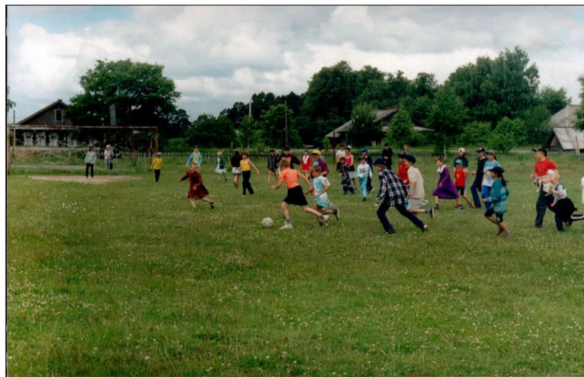
Большой и малый стадионы